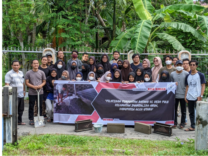
Pengabdian masyarakat yang dilaksanakan oleh dosen Fakultas Teknik Universitas Malikussaleh.