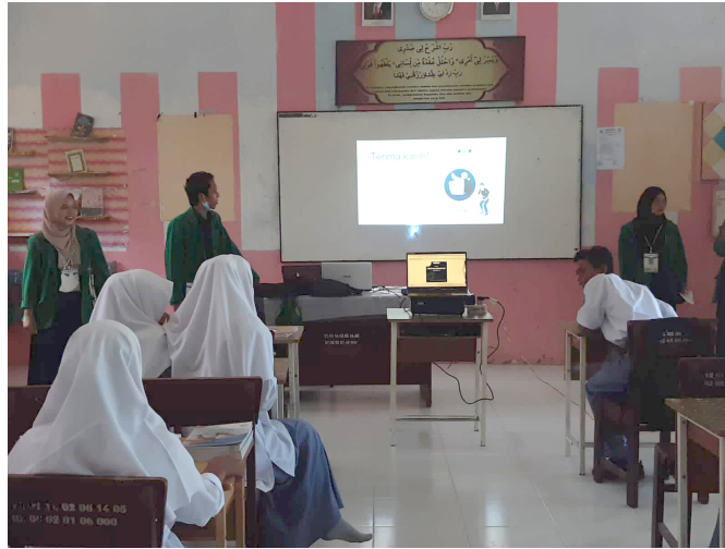
Giat Mahasiswa KKN 002 Ajarkan Teknologi Untuk Siswa SMA Negeri 5 Lhokseumawe.