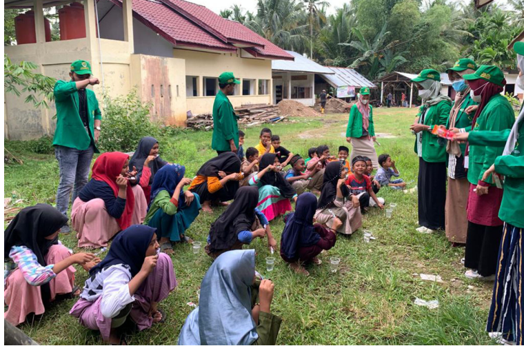
Mahasiswa Kelompok 165 menyelenggarakan kegiatan Senyum Ceria di Dayah Baburrahmah Desa Paloh Pundi, Kecamatan Muara Satu, Kota Lhokseumawe.