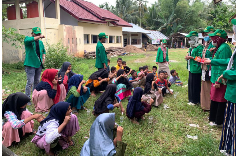
Mahasiswa Kelompok 165 menyelenggarakan kegiatan Senyum Ceria di Dayah Baburrahmah Desa Paloh Pundi, Kecamatan Muara Satu, Kota Lhokseumawe.