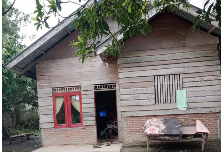
Rumah Ruslan Jalil (49), warga Gampong Nicah Awe Kecamatan Simpang Ulim, Aceh Timur yang layak mendapatkan bantuan kursi roda.