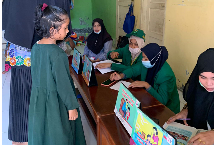
Mahasiswa Kelompok 133 ikut membantu kegiatan posyandu di Desa Lhok Awe Teungoh, Bireuen, beberapa waktu lalu.