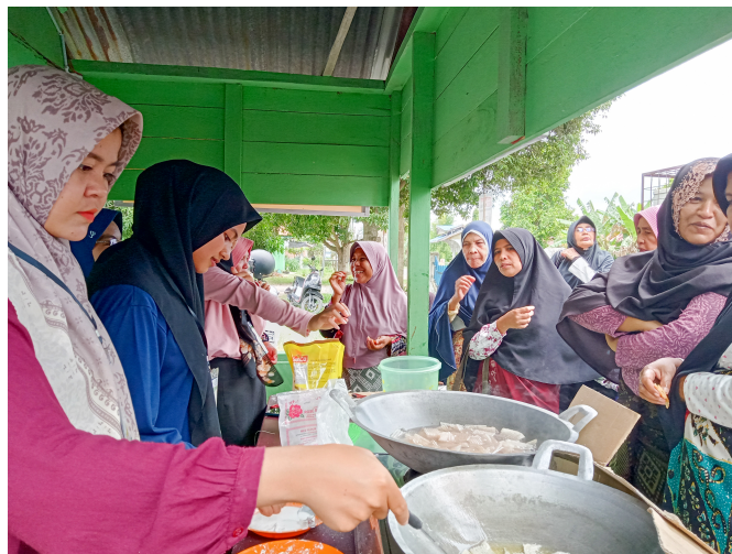
Mahasiswa KKN 255 Olah Pelepah Pisang Jadi Keripik.