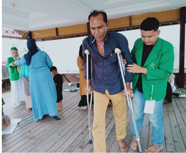
Ikut Serta Dalam Kegiatan Posbindu, Ini yang Dilakukan Mahasiswa KKN 222.