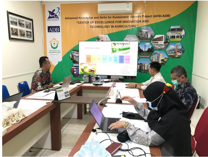
Tim AKSI-ADB Universitas Malikussaleh Lakukan Money Penelitian.