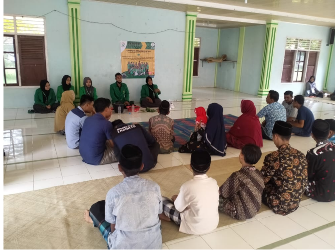
Mahasiswa KKN 242 Sosialisasi Pembuatan Pestisida Nabati untuk Segala Jenis Hama.