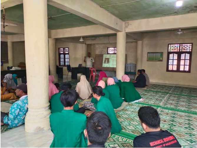
Mahasiswa KKN 022 Bantu Dosen Unimal Sosialisasi Teknologi Kompor Raket Biomassa