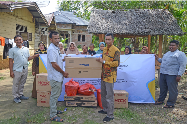
Dosen FISIP Universitas Malikussaleh Serahkan Alat dan Bahan Produksi Kue Kepada Kelompok IRT di Nisam.