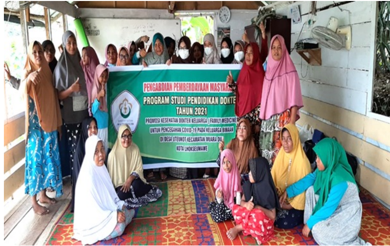
Dosen Kedokteran Unimal Berikan Promosi Kesehatan Kepada Masyarakat Gampong Uteunkot