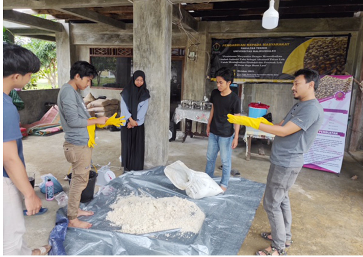
Dosen Jurusan Teknik Industri Universitas Malikussaleh melatih warga Gampong Hagu Barat Laut, Lhokseumawe, cara mengolah limbah tahu menjadi pakan ternak, belum lama ini.