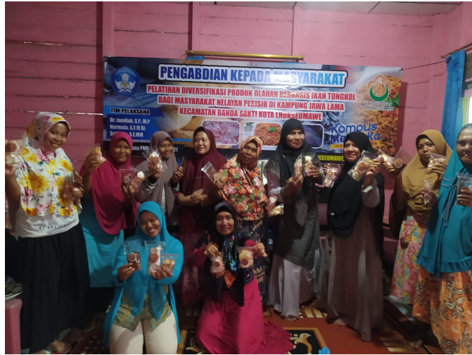
Dosen Unimal Gelar Pelatihan Olah Ikan Menjadi Abon dan Kerupuk.