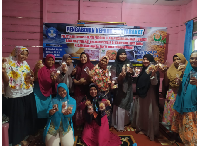
Dosen Unimal Gelar Pelatihan Olah Ikan Menjadi Abon dan Kerupuk.