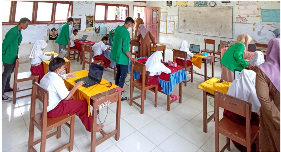
Mahasiswa KKN-PPM 159 Sosialisasi Penggunaan Komputer di SDN 3 Banda Baro