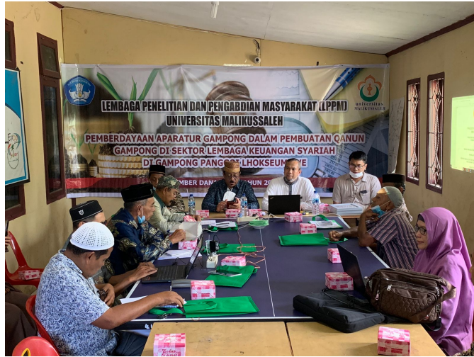
Tim Pengabdian Unimal Gelar Pelatihan Penyusunan Qanun Gampong tentang Syariah*