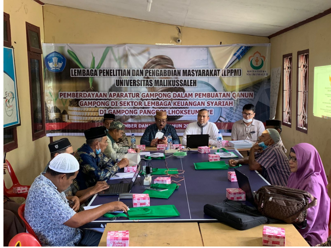
Tim Pengabdian Unimal Gelar Pelatihan Penyusunan Qanun Gampong tentang Syariah*