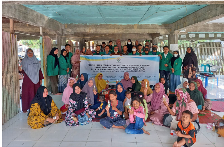
Dosen Unimal Gelar Penyuluhan Pembuatan Antiseptik Berbahan Herbal di Gampong Blang Gurah