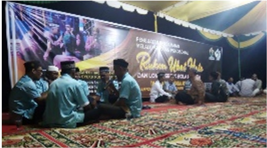
Dosen Unimal Gelar Psikososial “Rukon Ubat Hatee” dalam Rangka Penguatan Perdamaian Aceh