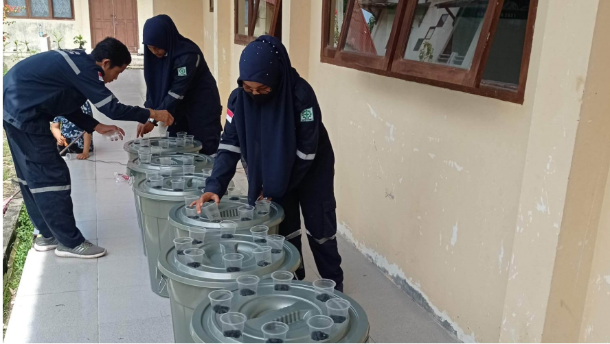
Teknik budi daya ikan lele secara akuaponik melalui budikdamber (budi daya dalam ember).