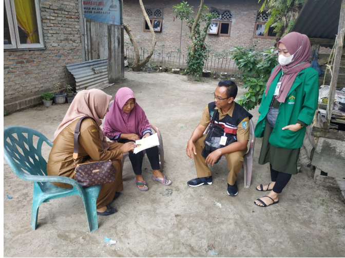
Mahasiswa KKN-MK P004 Sosialisasi Tertib Pajak