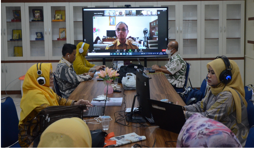
Asesmen Akreditasi Prodi Hukum Fakultas Hukum Universitas Malikussaleh, Foto: Bustami Ibrahim