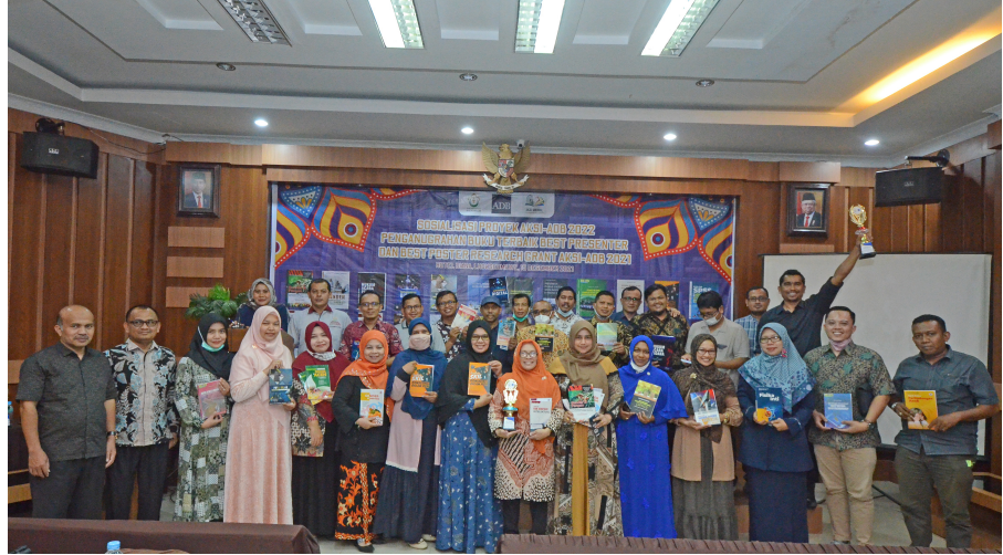
AKSI-ADB Universitas Malikussaleh Gelar Penghargaan Book Grant, Best Presenter, dan Best Poster Research.