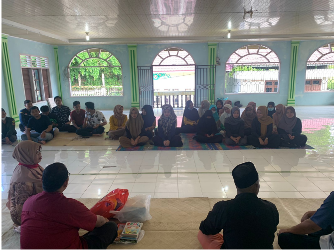
Dosen Administrasi Publik Unimal Gelar Pelatihan Inovasi UMKM di Meunasah Dayah