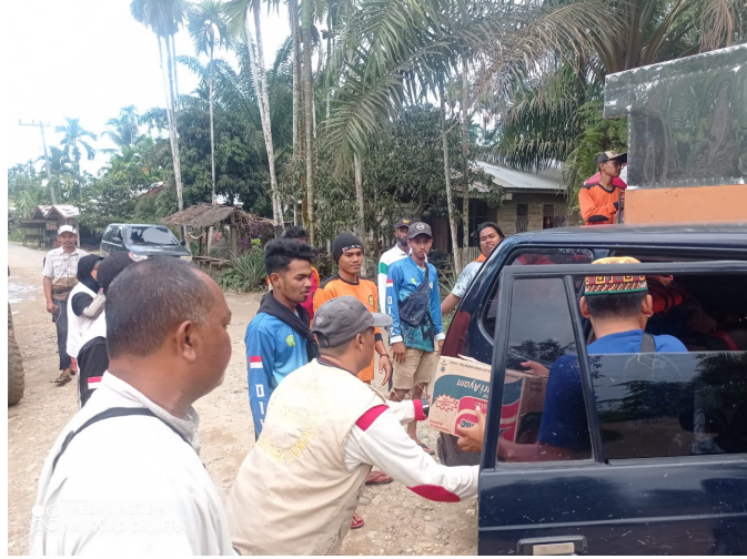
Relawan PBA Universitas Malikussaleh Bantu Distribusikan Logistik dan Evakuasi Korban Banjir di Aceh Utara