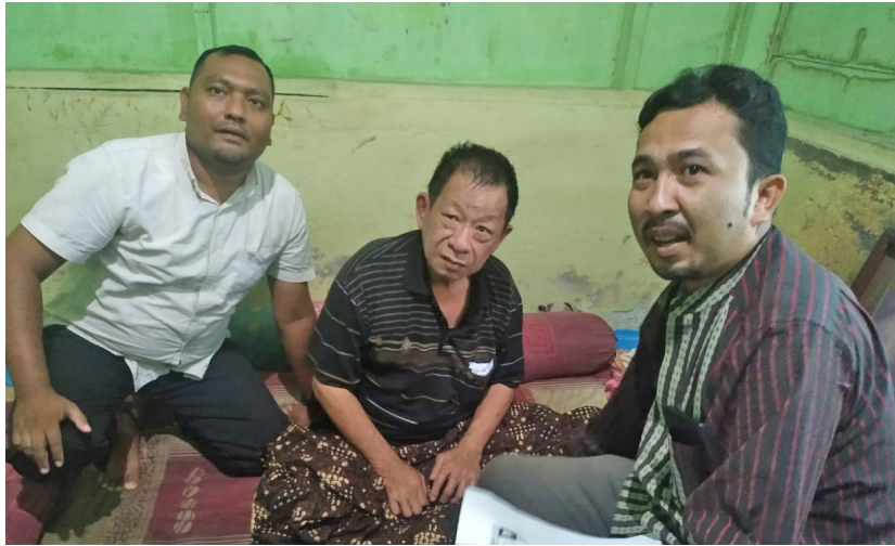
Mualaf ini Butuh Uluran Tangan Para Dermawan, Bazmal Universitas Malikussaleh Salurkan Bantuan Zakat.