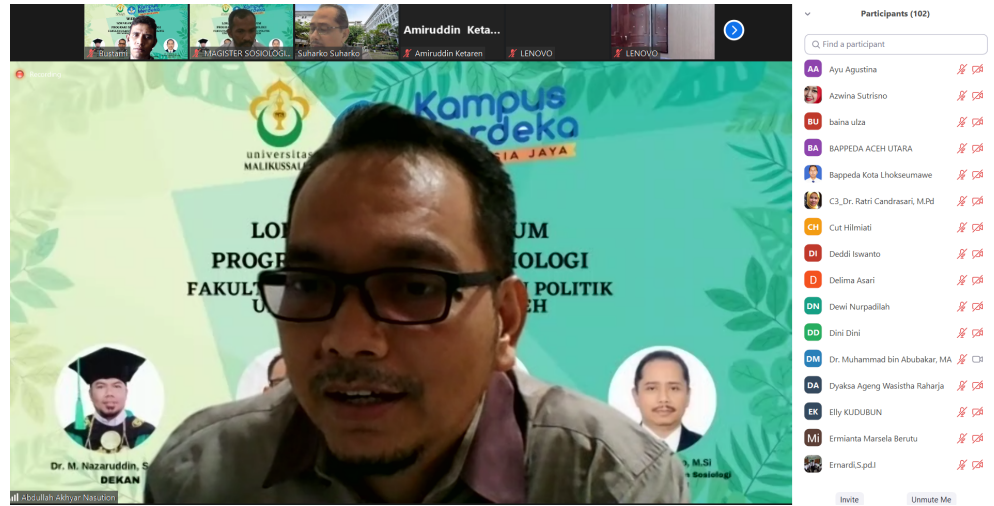
Tangkapan layar Zoom Meeting.