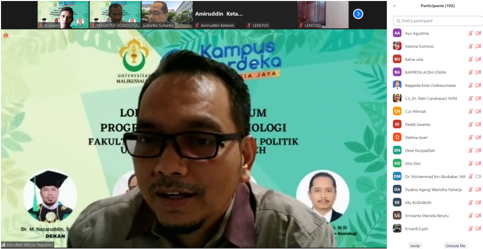
Tangkapan layar Zoom Meeting.