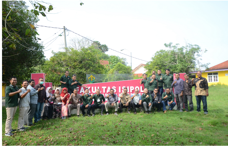
Fisipol Universitas Malikussaleh Teken MoA dengan Universitas Muhammadiyah Sumatera Utara.