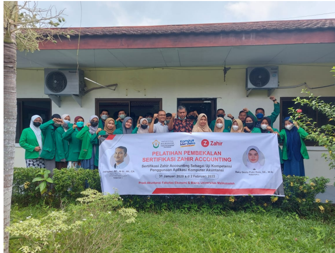
Bekali Skill Mahasiswa, Prodi Akuntansi Unimal Gelar Pelatihan Sertifikasi Zahir Accounting