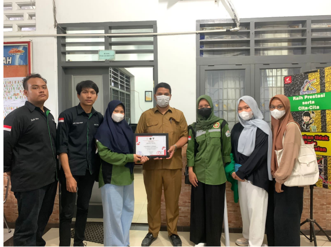
Mahasiswa Teknik Material Unimal Lakukan Sosialisasi Material Goes To School di Medan dan Takengon