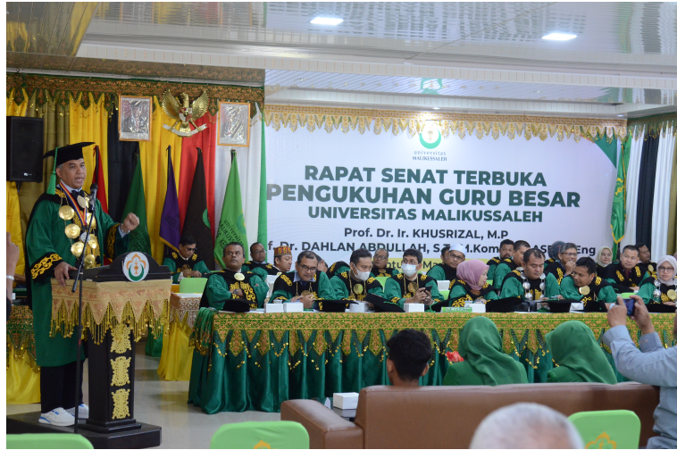
Rektor Unimal Kukuhkan Dua Guru Besar Baru.