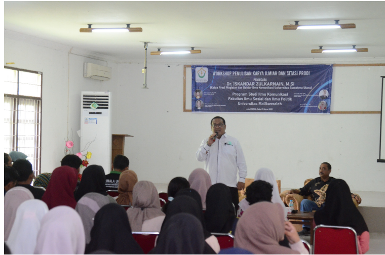
Prodi Komunikasi Unimal Gelar Workshop Penulisan Karya Ilmiah dan Sitasi Prodi.