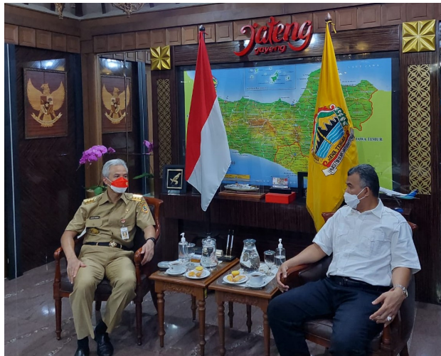
Ketua Umum PP Kagama yang juga Gubernur Jawa Tengah, Ganjar Pranowo berbincang dengan Rektor Universitas Malikussaleh yang juga pengurus K (25/10/2021).