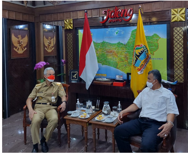
Ketua Umum PP Kagama yang juga Gubernur Jawa Tengah, Ganjar Pranowo berbincang dengan Rektor Universitas Malikussaleh yang juga pengurus K (25/10/2021).