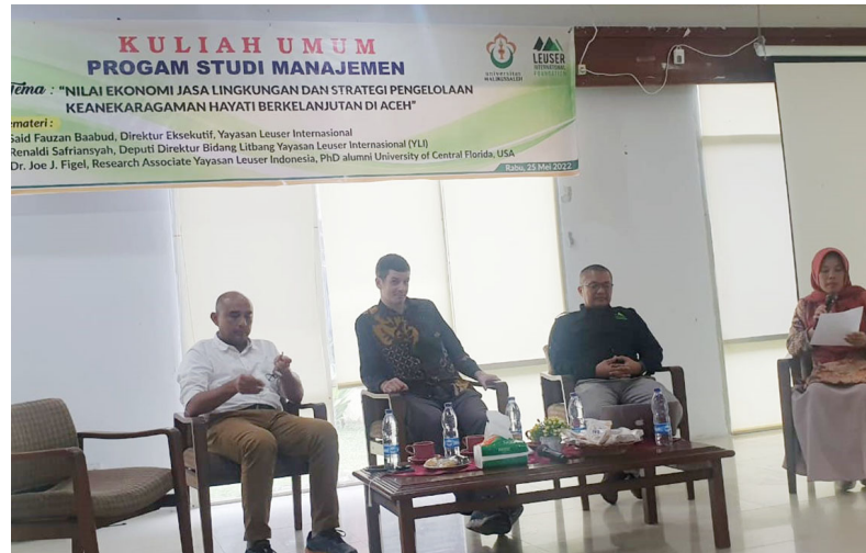
Tiga narasumber dari Yayasan Leuser Internasional menjadi narasumber dalam kuliah umum tentang "Nilai Ekonomi Jasa Lingkungan dan Strategi Pengelolaan Lhokseumawe, Rabu (25/5/2022).