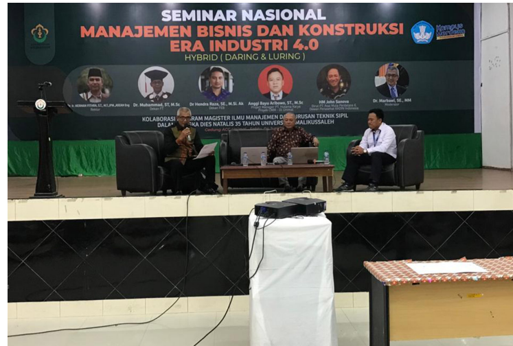
Seminar nasional hasil kolaborasi Fakultas Ekonomi dan Bisnis dengan Fakultas Teknik digelar di Aula Kampus Uteunkot, Lhok