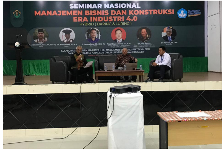
Seminar nasional hasil kolaborasi Fakultas Ekonomi dan Bisnis dengan Fakultas Teknik digelar di Aula Kampus Uteunkot, Lhok