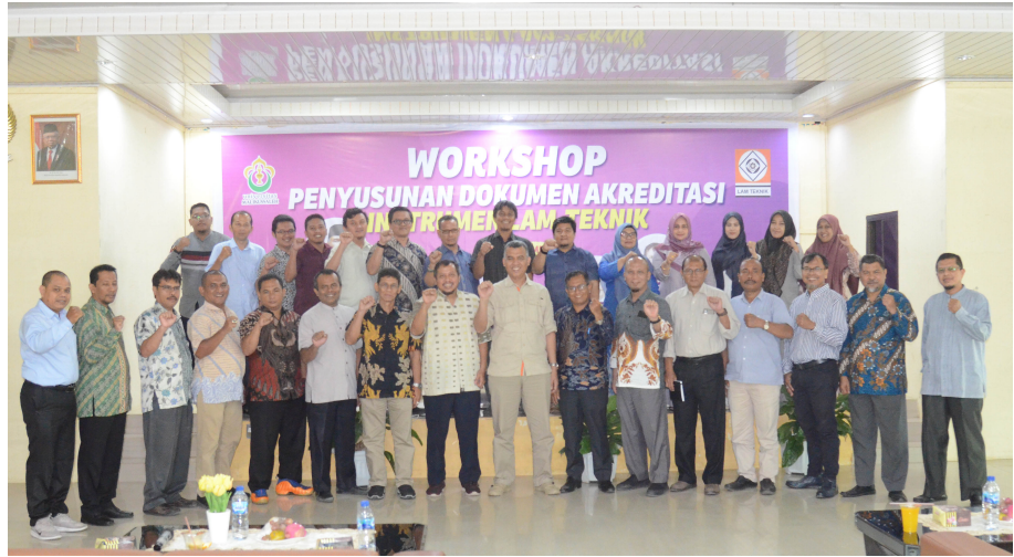
Teknik Sipil Unimal Adakan Workshop Penyusunan Dokumen Akreditasi.