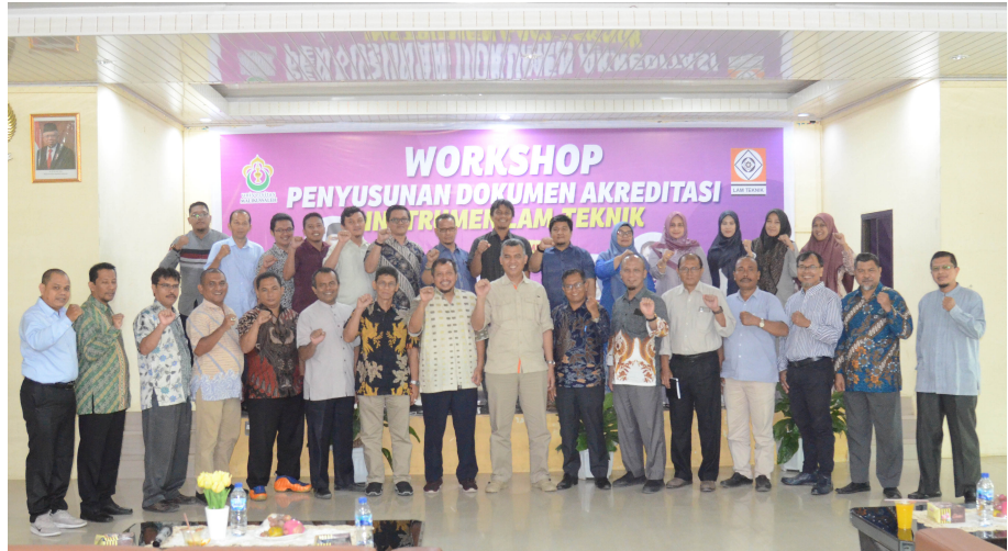
Teknik Sipil Unimal Adakan Workshop Penyusunan Dokumen Akreditasi.