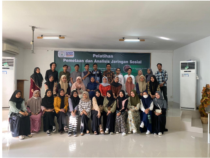
Antropologi Unimal Gelar Pelatihan Pemetaan dan Analisis Jaringan Sosial.