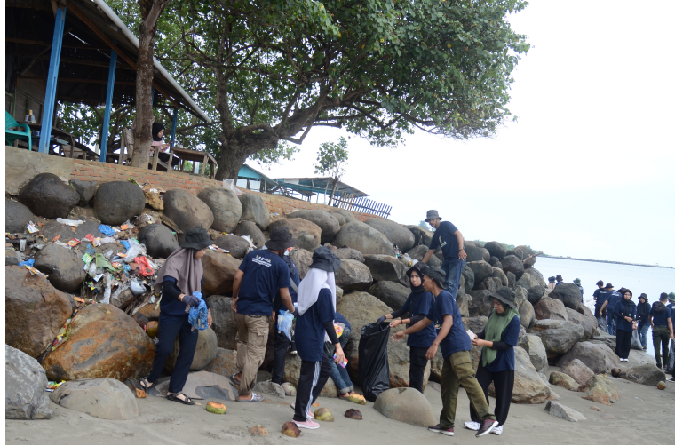
Sivitas Akademika Unimal Bersihkan Sampah di Pantai Laut Ujong Blang.