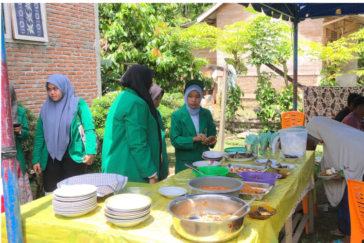
Tingkatkan Kebersamaan Bersama Warga, Mahasiswa KKN 12 Ikut Berpartisipasi di Acara Aqiqah.