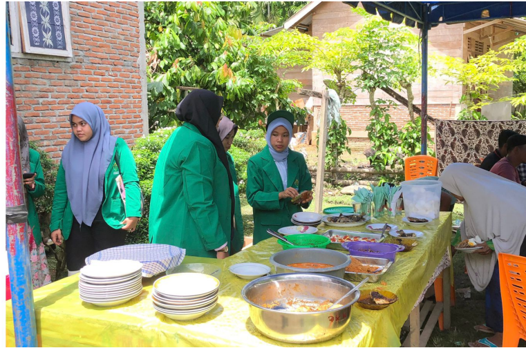
Tingkatkan Kebersamaan Bersama Warga, Mahasiswa KKN 12 Ikut Berpartisipasi di Acara Aqiqah.