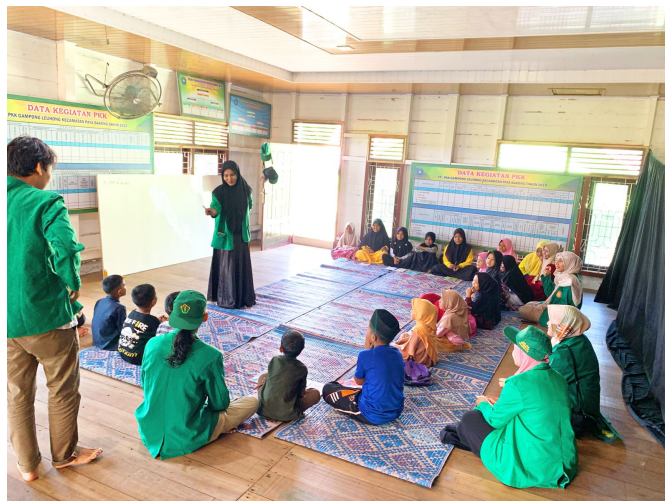
Mahasiswa KKN Kelompok 14 Buka Kelas Bahasa Inggris untuk Siswa Sekolah Dasar.