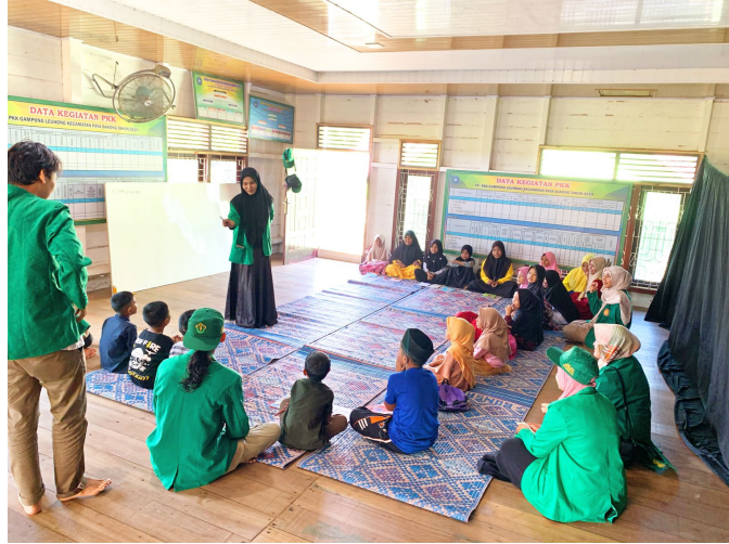
Mahasiswa KKN Kelompok 14 Buka Kelas Bahasa Inggris untuk Siswa Sekolah Dasar.