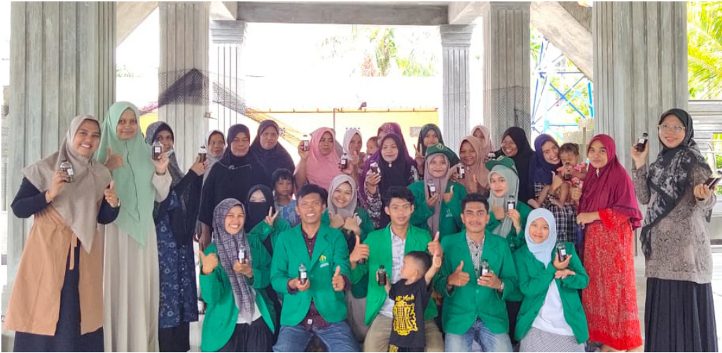
Mahasiswa KKN 06 Ini Sulap Tanaman Herbal Jadi Minuman Imun Booster.