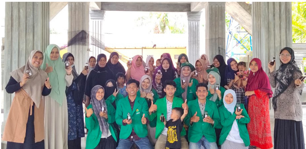
Mahasiswa KKN 06 Ini Sulap Tanaman Herbal Jadi Minuman Imun Booster.