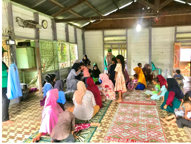
Mahasiswa KKN Kelompok 20 Bantu Sukseskan Posyandu di Gampong Pucok Alue.