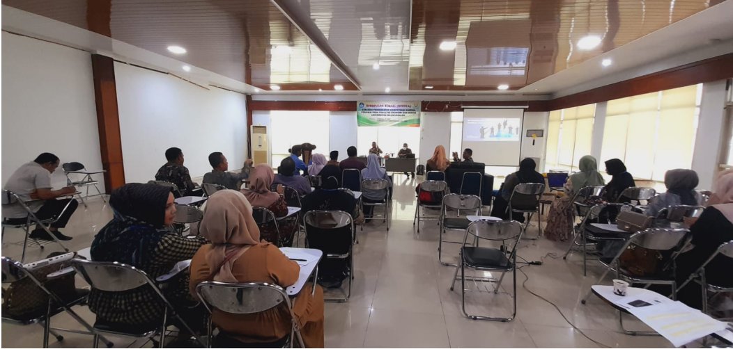
Tingkatkan Kompetensi Kinerja Pegawai, FEB Universitas Malikussaleh Adakan Bimtek.