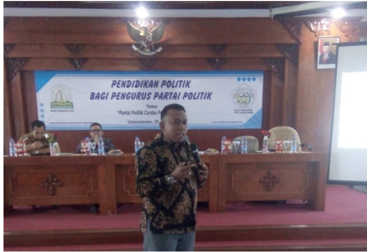
Dosen Unimal Beri Pendidikan Politik Kepada Para Pengurus Partai Politik di Lhokseumawe