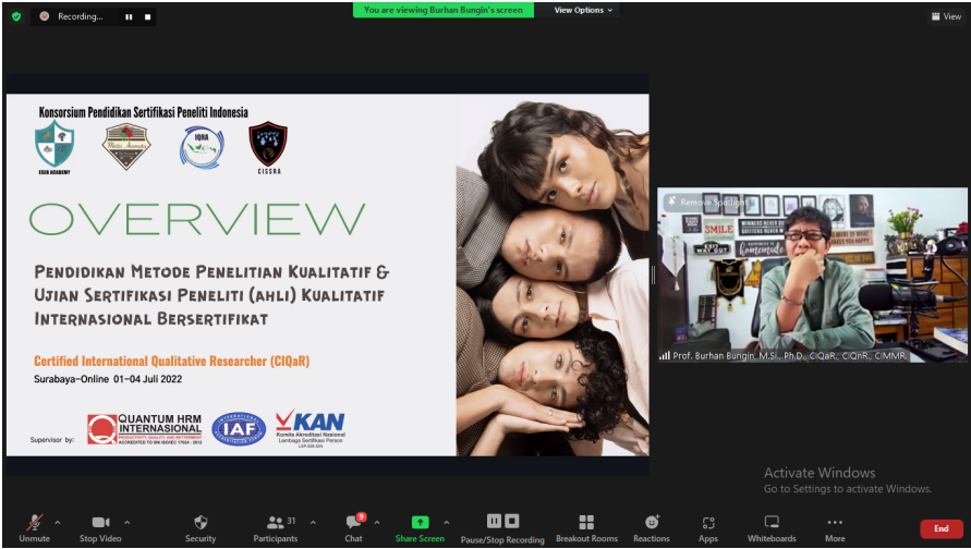
Tiga Dosen FISIP Unimal Peroleh Sertifikat Kompetensi Internasional dalam Penelitian Kualitatif