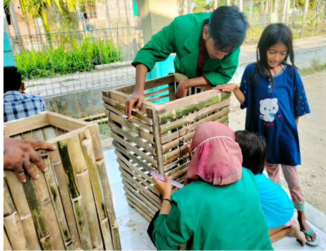
Mahasiswa KKN Kelompok 28 di Gampong Geulumpang Kecamatan Pirak Timu, Aceh Utara, membuat tong sampah berbahan bambu sebagai bagian untuk mendukung kebersihan lingkungan.