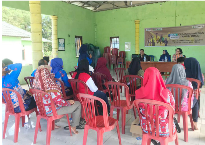
Mahasiswa Universitas Malikussaleh dan mahasiswa lain peserta KKN Kebangsaan melakukan sosialisasi di Desa Garantung Kecamatan Maluku Kabupaten P Pisau, Kalimantan Tengah.