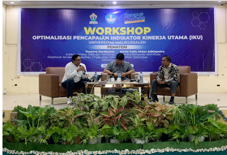
Biro Akademik menggelar workshop tentang peningkatan Indikator Kinerja Utama (IKU) di Aula Cut Meutia Kampus Bukit Indah, Lhokseumawe, Senin (25/7/2022).