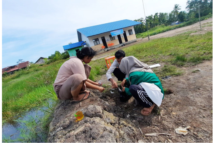
Mahasiswa KKN Kebangsaan di Kalimantan Tengah, termasuk dari Universitas Malikussaleh, mengolah daun kelor