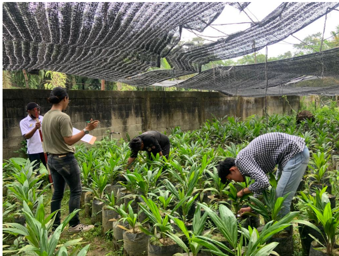
Ikuti PKL, Lima Mahasiswa Pertanian Unimal Ditempatkan di PPKS Unit Marlihat