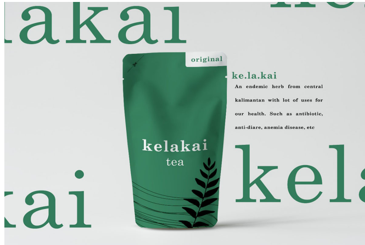
Salah satu produk mahasiswa KKN Kebangsaan di Desa Terusan Karya, Kecamatan Bataguh, Kabupaten Kapuas, Kalimantan Tengah.