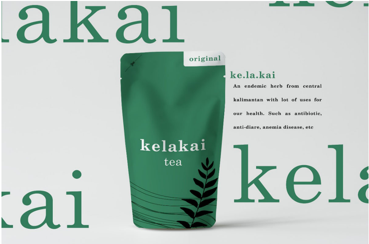
Salah satu produk mahasiswa KKN Kebangsaan di Desa Terusan Karya, Kecamatan Bataguh, Kabupaten Kapuas, Kalimantan Tengah.